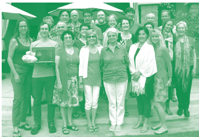
Diretoria e Corpo Docente da Jin Shin Jyutsu, Inc.

Este formato descende do curso de Mentoring de 5 dias que acontece em Scottsdale. Agora, oferecido na cidade onde o instrutor local reside, o curso proverá um ambiente mais íntimo, com no máximo 9 alunos e um instrutor, explorando as profundidades, aplicações práticas e a simplicidade do Jin Shin Jyutsu. Cada aluno irá receber sessões durante os 3 dias. Os requisitos para estes cursos são os mesmos que o instrutor adota para o Mentoring de 5 dias. Quaisquer diferenças serão comunicadas.